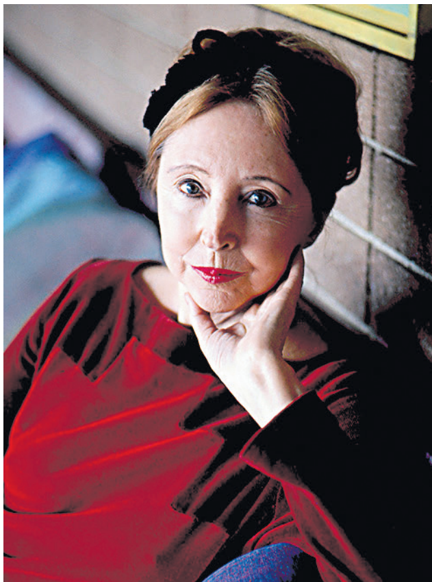
Anaïs Nin, sensual, rica, escritora, multiorgásmica.