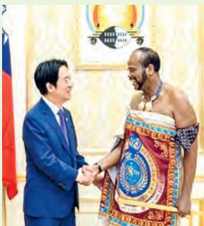
El presidente Lai Ching-te (izquierda) estrecha la mano del rey Mswati III el 2 de mayo en el Palacio Real de Lozitha, en Esuatini.

El mandatario expresó su esperanza de que este