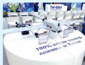
Los drones fabricados en Taiwán se exhiben en exposiciones internacionales como parte de los esfuerzos del Gobierno por expandir la presencia mundial del sector local.

La producción de dicho sector local en 2025 ascendió a 12.900 millones de dólares taiwaneses, un 158 por ciento