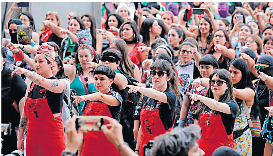
La presencia de las mujeres en política comprometida, es es cada vez más nítida.

Un congresista actualmente percibe un ingreso mensual total aproximado de S/ 29,400, desglosa-