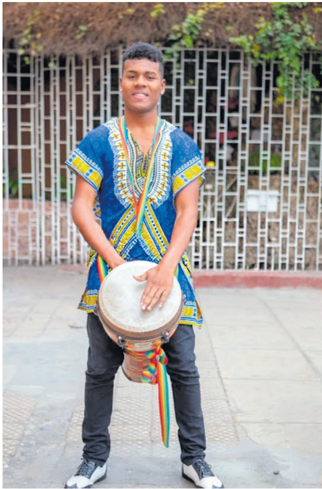
Todos tienen derecho a una educación y cultura política

La alfabetización política consiste en un proceso mediante el cual, las personas "aprenden a desenvolverse eficazmente en la vida pública a través del conocimiento y los valores". Se define como "el conocimiento y la comprensión del proceso político y los