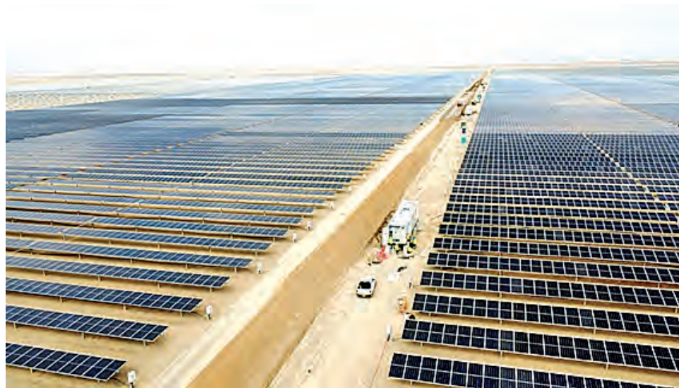
La planta fotovoltaica Illa tendrá 700,000 paneles solares en La Joya.

en operación como Reparición Solar, Majes Solar, Matarani y San Martín Solar y a proyectos en desarrollo, como Illa, Solimana, Sol de Verano y Babilonia, consolidando un corredor energético en expansión en provincias como Ilay, Caylloma y La Joya.