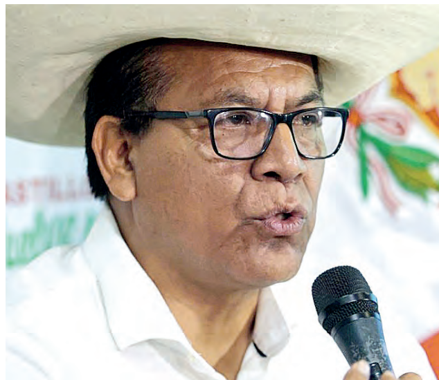
Líder de Juntos por el Perú va camino a la Presidencia con la fuerza de un Perú que reclama reivindicaciones que la derecha siempre soslayó.

SEGÚN ENCUESTA IPSOS , líder de Juntos por el Perú viene en un rush impresionante, como una locomotora, lo que le faculta grandes posibilidades de llegar a la Presidencia de la República.