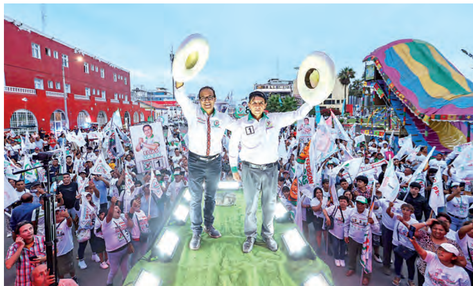
La Izquierda peruana ha encontrado en José Mercedes Castillo Terrones un nuevo guía.

DOS NOMBRES, UNA SOLA ESENCIA: cómo la #RutaCastillista conquistó el corazón de las mayorías olvidadas y reescribió el mapa electoral.