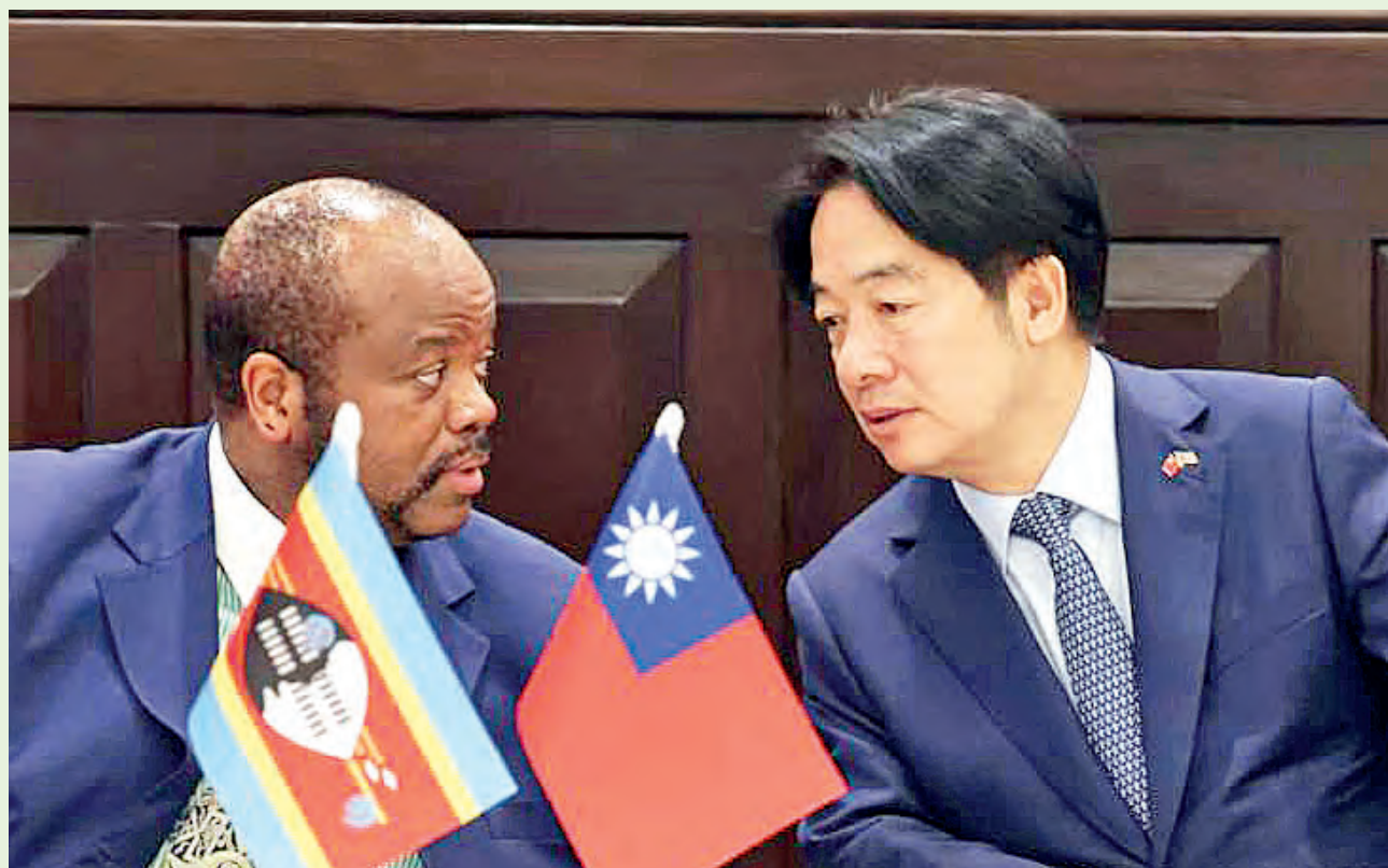
Foto: El presidente Lai Ching-te (derecha) se reunió con el rey Mswati III del Reino de Eswatini en 2024. (Cortesía de CNA Taiwan)

El viaje del Presidente Lai a Eswatini, tuvo que posponerse lamentablemente, debido a la cancelación de los permisos de vuelo por parte de Seychelles, Mauricio y