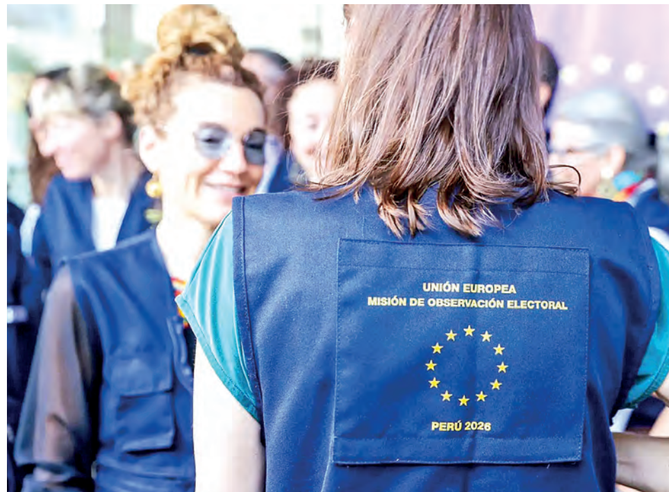
La MOE - UE también se mostró a favor de que las investigaciones sobre irregularidades se realicen respetando el marco legal.

MISIÓN LLEGADA PARA OBSERVAR LOS COMICIOS emitirá un informe con recomendaciones tras concluir la segunda vuelta presidencial.