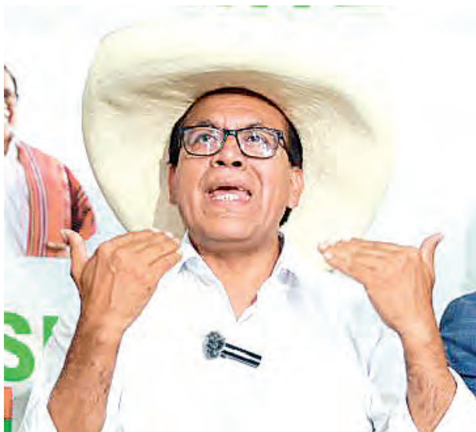
Se va concretando la simpatía nacional por Roberto Sánchez y su plan de refundación del Perú.

Según la página web del ente electoral, Fujimori se ubica en el primer lugar con 17,048% y 2.716.120 votos, Sánchez en el segundo puesto con 12,035% y 1.917.419 votos y López Aliaga en la tercera