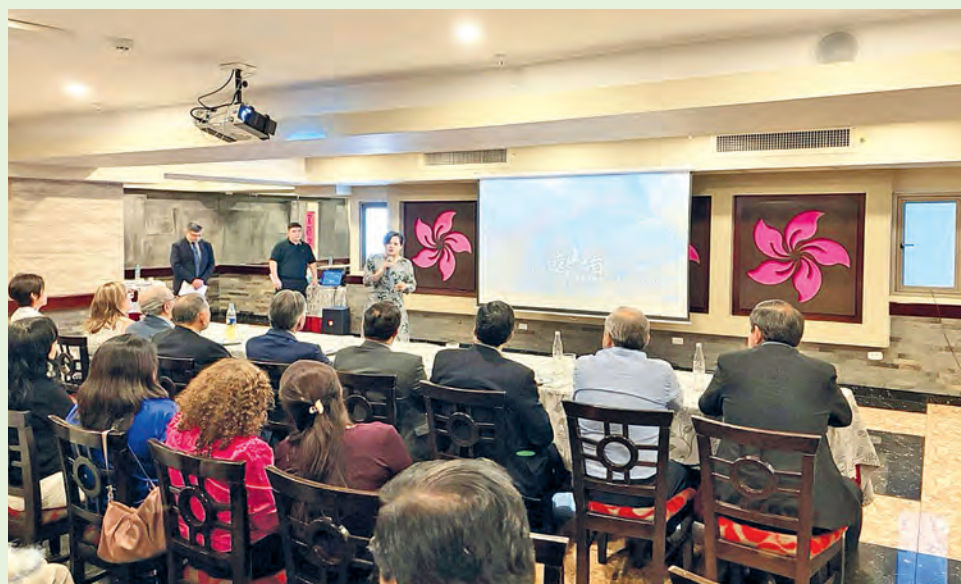
Francisca Yu-Tsz Chang, Repr. de Taiwán en el Perú preside la charla luego del estreno del documental.