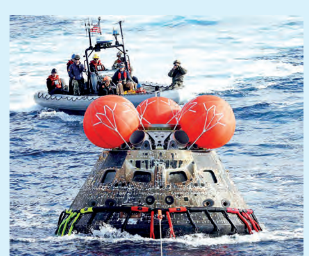
OPERACIÓN DE LA NASA ABRE PASO AL RETORNO HUMANO AL SATÉLITE TRAS MÁS DE 50 AÑOS

En ese sentido, el llamado a la ciudadanía es a respetar la ley seca y contribuir al desarrollo de unas elecciones seguras y ordenadas, en un contexto donde se busca reforzar la transparencia y la participación democrática.