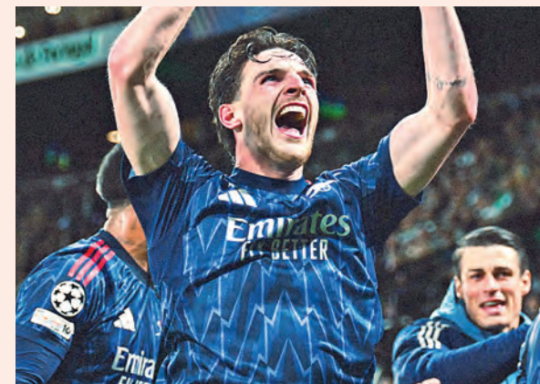
CHAMPIONS LEAGUE: GANÓ CON GOL DE HAVERTZ

A los 73' un rápido ataque por derecha del Madrid, le permitió a Alexander Arnold centrar a rastrón pasado para que Kylian Mbappé rematara y el balón pese a bloquear Neuer pasó la línea del arco, para el descuento merengue. Luego intentó al menos salvar con el empate, pero no lograron su objetivo.