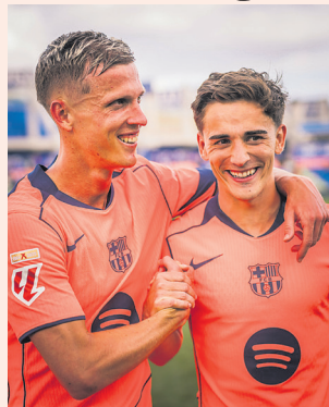
Con la baja de su estre-

En la continuidad de la fecha 32 de la Liga de España, el líder FC Barcelona venció a domicilio al Getafe 2-0, y con ello amplió su diferencia con su escolta Real Madrid a 11 puntos (85-74), cuando faltan seis fechas para culminar la temporada 2025-2026. Se jugó en el estadio Coliseum Alfonso Pérez de la capital española.