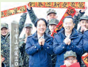
El presidente Lai Ching-te (centro) celebra el Año Nuevo lunar con personal militar en la Estación de Radar Xiaoxueshan en Taichung.

El mandatario hizo tales declaraciones en un video pregrabado publicado el 15 de febrero, antes de la víspera del Año Nuevo lunar. Lai agradeció a las tropas y miembros de la guardia costera por su labor ininterrumpida, así como al personal dedicado en