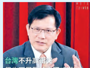
El ministro de Relaciones Exteriores, Lin Chia-lung, reitera su compromiso con la ampliación de la cooperación entre Taiwán y Estados Unidos.

Asimismo, Lin indicó que existe una clara continuidad estratégica entre las políticas del presidente estadounidense Donald Trump durante su primer