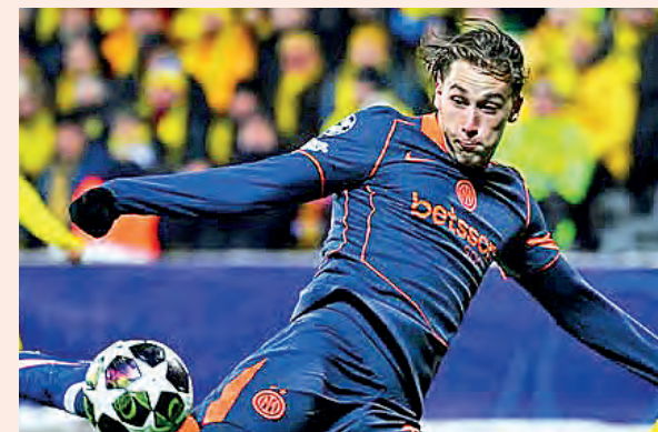
CHAMPIONS LEAGUE: EN JUEGO DE IDA DE LOS PLAYOFFS

"¿Hay que culpar a Vini? ¿Que no debería celebrarlo así? ¿Cómo? Es inaceptable". El fútbol es un deporte bonito. Por ejemplo, ¿por qué amamos a Roger Milla? Por cómo lo celebró con sus aficionados. Están intentando robarnos lo bonito de este deporte. Esta clase de basura, estas ratas que dicen esos comentarios racistas, deben ser castigados. No tenemos que protegerlos".