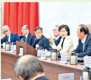
La vice primera ministra Cheng Li-chiun (quinta a la izquierda) toma la palabra en la 16.ª reunión del Comité de Política de Seguridad Nacional el 8 de enero en la ciudad de Taipéi.

Antes de la reunión, Cheng entregó premios a agencias e individuos que participaron en los ejercicios de resiliencia urbana 2025, organiza-