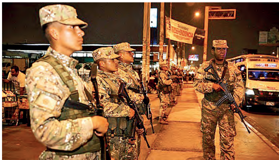
El Estado está obligado a detener este baño de sangre diario en todo el país.

Hoy las principales víctimas son los trabajadores del transporte público. Conductores que salen de casa sin saber si volverán. Empresas que llevan más de un año siendo extorsionadas. En algunos casos, obligadas a pagar a tres o más bandas criminales al mismo tiempo. La 41 en Lima Este, “El Chino” en el