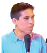
Por: Omar Chira Fernández

EL PRIMERO SE DIO EL 22 DE OCTUBRE POR 30 DÍAS Y EL SEGUNDO FUE EL 20 DE NOVIEMBRE. ¿VEMOS RESULTADOS?