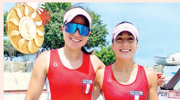
EN REMO: MODALIDAD W2X FEMENINO