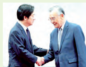
Presidente Lai Ching-te (izquierda) despidiendo a Lin Hsin-i, Representante de Taiwán ante APEC (derecha), antes de su partida a Corea del Sur.

En nombre del presidente Lai Ching-te, Lin transmitió tres mensajes clave: fortalecer la resiliencia económica de Taiwán, contribuir activamente al desarrollo comercial regional y