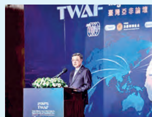
El primer ministro Cho Jung-tai interviene en la 7.ª edición del Foro Taiwán-Asia Occidental y África sobre Seguridad Regional y Crimen Transnacional el 29 de octubre en Taipéi.

El primer ministro destacó que el gasto en defensa nacional representa el 3,32 por ciento del