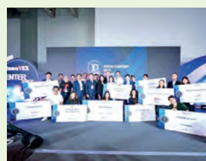
Empresas del Ecosistema de Emprendimiento de Institutos de Investigación de Taiwán ganan cinco premios en el Concurso de Presentaciones InnoVEX el 23 de mayo en la ciudad de Taipéi.

Según el MOEA, las empresas TREE obtuvieron 23.000 dólares en premios, además de asesoramiento profesional y recursos inter-