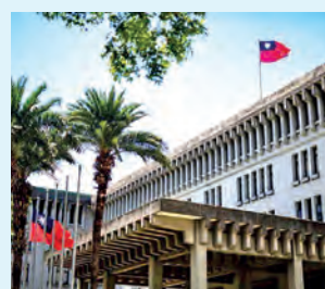
El Ministerio de Relaciones Exteriores publicó una declaración conjunta para conmemorar el décimo aniversario del Marco Global de Cooperación y Capacitación el 27 de mayo.

Establecido por la Oficina Económica y Cultural de Taipéi (TECO, siglas en inglés) en Estados Unidos y el AIT en 2015, y al que posteriormente se unieron Japón, Australia y Canadá, el GCTF ha organizado 87 talleres a los que han