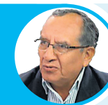
OPINIÓN OLMEDO AURIS MELGAR

Un idiotita cacarea que el suicidio cobarde de un ex mandatario constituyó la centralidad aviesa de “un crimen de Estado”. ¡Bah! Huir de la justicia, no es valentía, es pusilanimidad.