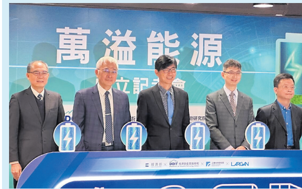
El Min. de Economía y Largan Precision presentan una nueva empresa, Wan Yi Energy

El Ministerio de Economía anunció la formación de una nueva empresa, Wan Yi Energy, en colaboración con la empresa líder en tecnología óptica, Largan Precision. El objetivo es desarrollar materiales de electrodos negativos de iones de litio, específicamente el "niobato de titanio", que se espera sea el más rápido en carga a nivel mundial. Largan Precision invertirá 450 millones de dólares taiwaneses en este proyecto, que aprovechará tecnologías transferidas por el Instituto de Investigación Tecnológica para entrar en el mercado de vehículos eléctricos y almacenamiento de energía.