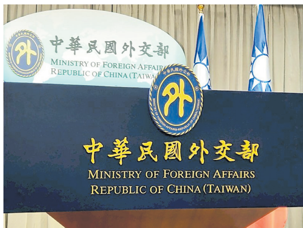
Ministerio de Relaciones Exteriores

Estado de los Estados Unidos ha destinado 100 millones de dólares para ayudar a fortalecer la seguridad de Taiwán, calificando esta inversión como histórica. Exteriores