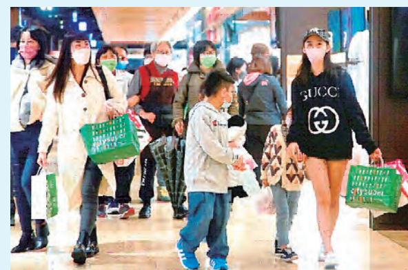
Aumenta la confianza de los consumidores para el 2024

Según la última encuesta de confianza económica nacional de Participaciones Financieras Cathay en enero de este año, el índice de optimismo