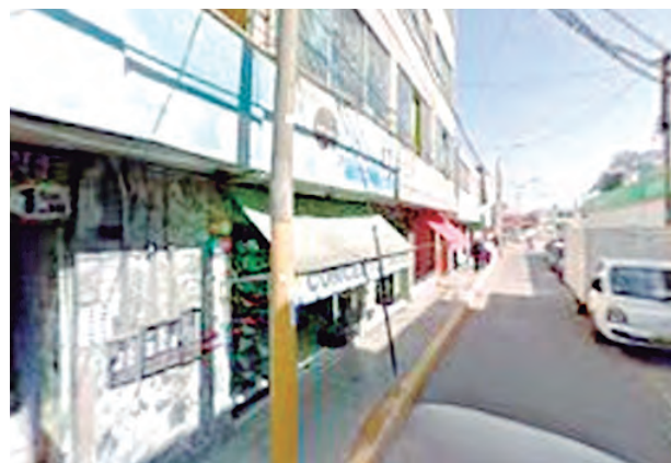
Supuestamente en este local, se lavaron más de 100 mil prendas.

Y es que Entori para, acreditar la experiencia