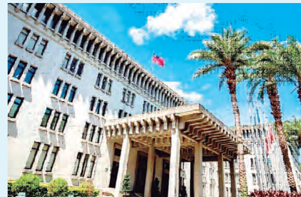
El Ministerio de Relaciones Exteriores, República de China (Taiwán).

En línea con los esfuerzos para alentar a las organizaciones internacionales a abrir sucursales en Taiwán, el Gobierno continuará revisando las regulaciones a fin de for-