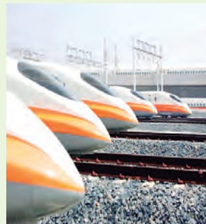
Tren de Alta Velocidad de Taiwán (THSR, siglas en inglés)