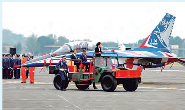
Tsai Ing-wen junto al caza de entrenamiento Brave Eagle

Durante la ceremonia, Tsai Ing-wen enfatizó que, en medio de la complejidad geopolítica internacional, cada piloto siente una profunda misión de contribuir a la seguridad nacional. El recién independizado comando se encargará de la formación de pilotos y la integración de los nuevos aviones de entrenamiento, estableciendo procesos y