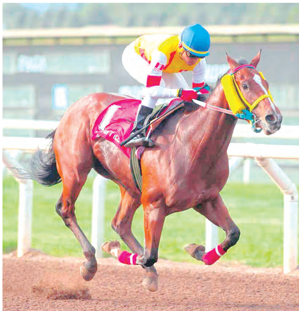
Existe enorme confianza en la caballeriza del Ju Ya

LOS JUVENILES SE ENFRENTAN en el Clásico Manuel Quimper; no corre el invicto Have a Nice Day.