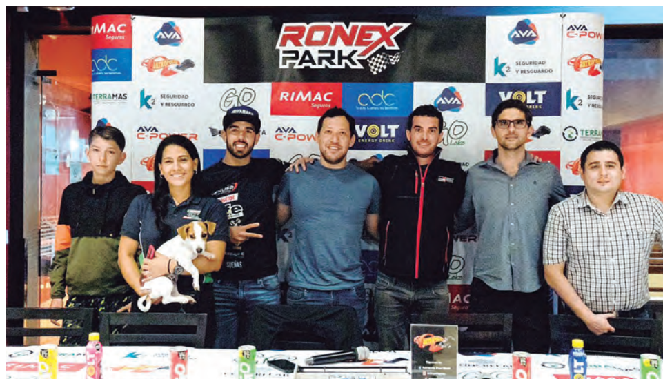
Los pilotos que estarán mañana, en la conferencia de prensa previa.

COMPETENCIA A REALIZARSE EN LURÍN , fue presentado el jueves en concurrida conferencia de prensa, con presencia de pilotos participantes.