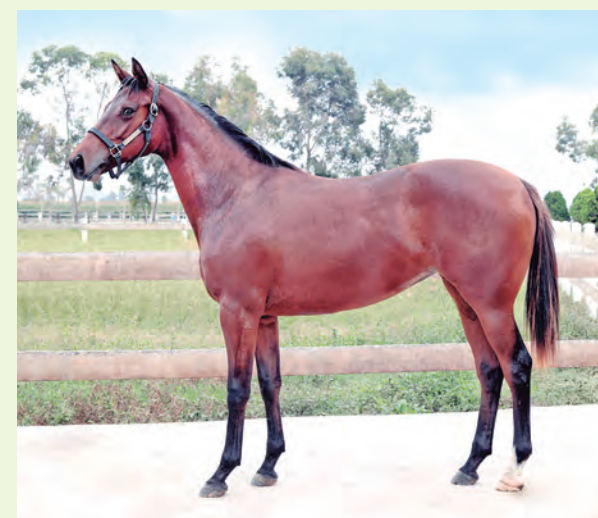
Será una de las piezas estelares del remate.

La expectativa es enorme en relación a lo mejor de los criaderos locales, con productos que tendrán participación directa a una serie de clásicos que se disputan cada año con sumas por el orden de los 160 mil dólares en premios. El lote saldrá a ventas, en dos fechas, miércoles y sábado de la próxima semana.