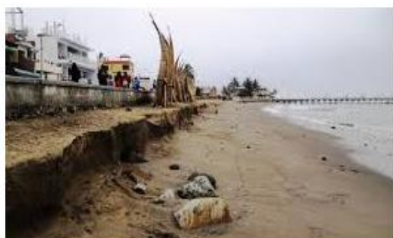
6. BALNEARIO DE HUANCHACO, UN ANTES Y DESPUES DE LA EROSION COSTERA Y BIODIVERSIDAD.