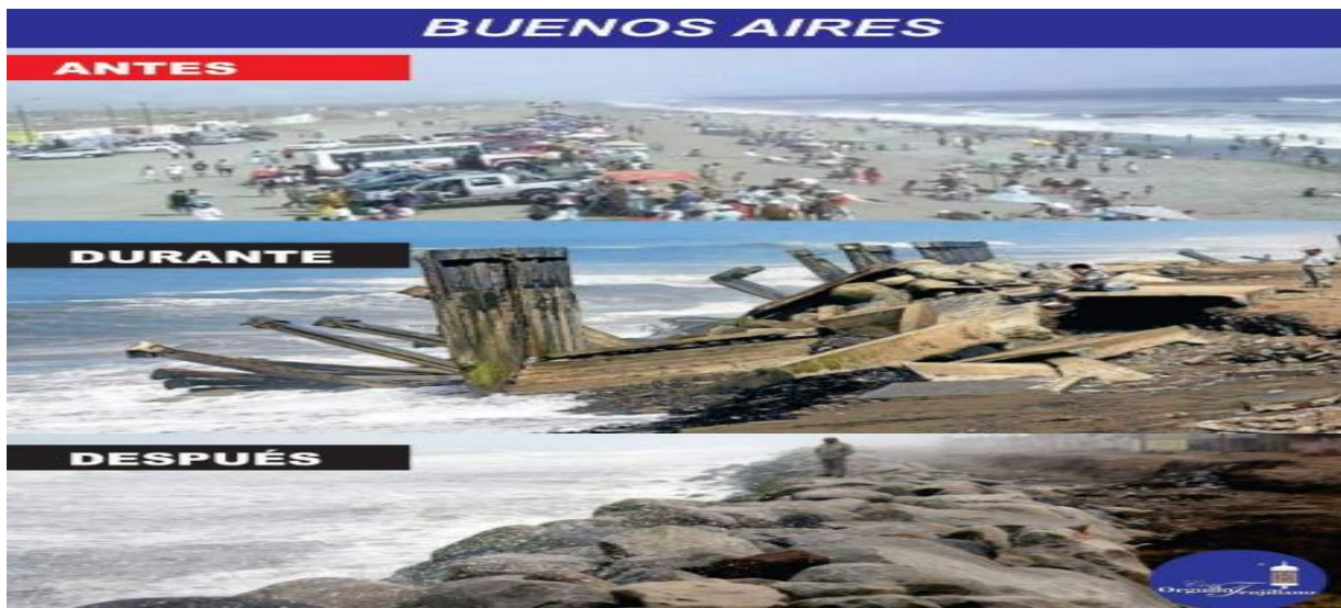
5. BALNEARIO DE BUENOS AIRES, UN ANTES Y DESPUÉS DE LA EROSIÓN COSTERA Y DAÑO A LA BIODIVERSIDAD.

Resulta de aplicación lo establecido en las Cláusulas 14.14 a 14.16 respecto".